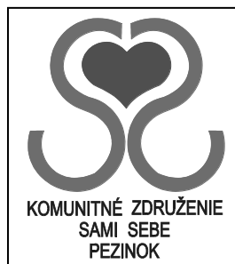
KOMUNITNÉ ZDRUŽENIE SAMI SEBE PEZINOK

A to je i hlavným poslaním našej organizácie. Verím, že keď ste sa takto naštartovali, do budúcnosti Vám Váš elán a schopnosti meniť svoj život a okolie potrvá a naša spolupráca bude naďalej pokračovať v prospech všetkých.